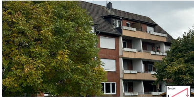
Konzept Immobilien GmbH